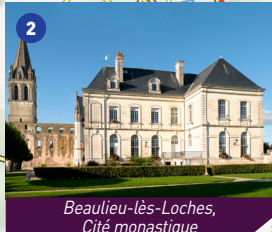
Beaulieu-lès-Loches, Cité monastique