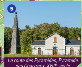
La route des Pyramides, Pyramide des Chartreux, XVIII e siècle