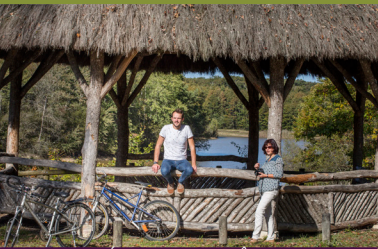
Etang du Pas-aux-Ânes, reconstitution du kiosque du XIX e siècle