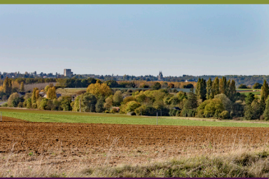
À travers champs