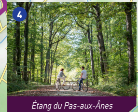
Étang du Pas-aux-Ânes