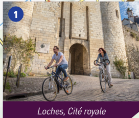
Loches, Cité royale

Circuit balisé dans les deux sens Signposted in both directions