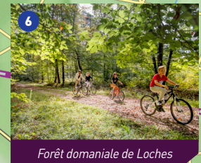
Forêt domaniale de Loches